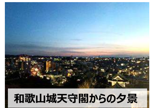
和歌山城天守閣からの夕景